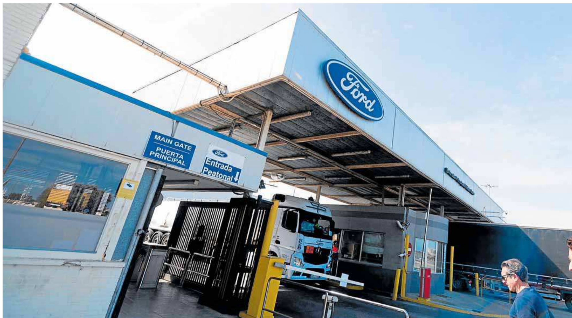
Dos trabajadores acceden a la factoría de Ford en Almussafes.

Para Faubel, el anuncio de la marca del óvalo es «una muy buena noticia», aunque ahora la principal dificultad es el tiempo de espera hasta que arranque la producción: «Tendremos que ver cómo hacemos ese tránsito para